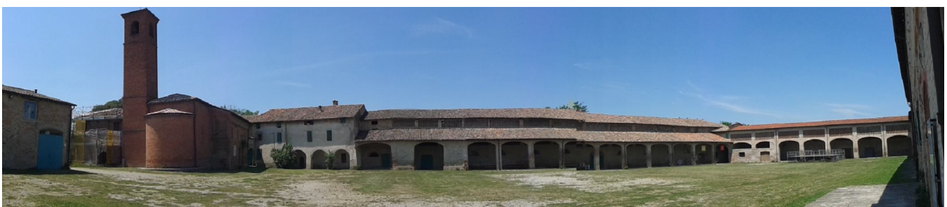
Collecchio nella riserva fluviale del Taro (Corte di Giarola in foto).

Per il rientro siamo partiti la mattina del 2 giugno e abbiamo fatto sosta vicino a